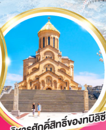
วิหารศักดิ์สิทธิ์ของทบิลซี