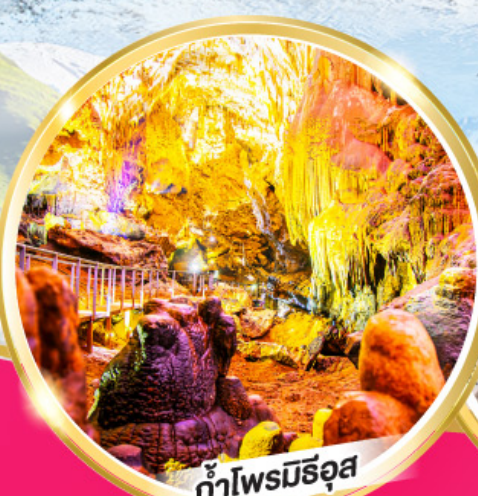
ถ้ำไฟมณีรุส