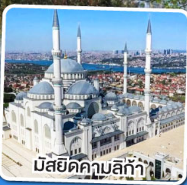
มัสยิดคามาบลีก้า