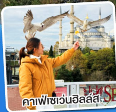
คาเฟ่เซเวนฮิลล์ส

พวงกุญแจ Evil Eye ชาเอ็ปเปิ้ล, โยศครีมมาโก