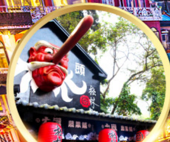
หมู่บ้านปิตาจซีโก