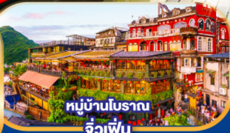
หมู่บ้านโบราณ จิวเฟิ่น

เมนูพิเศษ!! บุฟเฟ่ต์ชาบู สโตร์ไต้หวัน, ปลาประธาราธิบดี SEAFOOD สโตร์ไต้หวัน