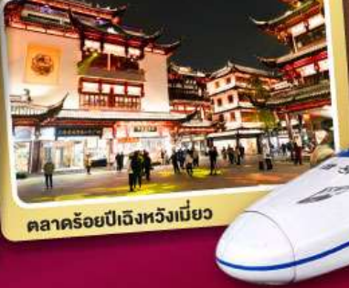
ตลาดร้อยปีเจิ้งหวิงเมี่ยว