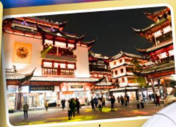
ตลาดร้อยปีเจียงหนิงเมี่ยว