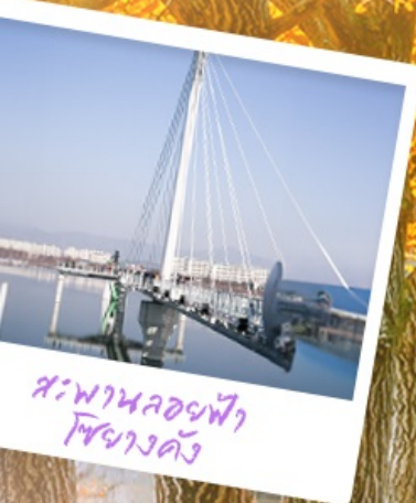
สะพานลอยฟ้า โซฮางคัง