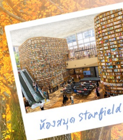
ห้องสมุด Starfield