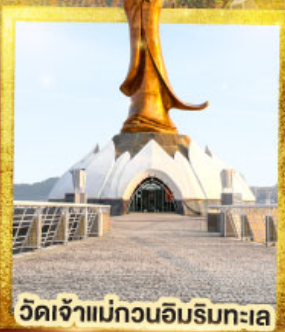
วัดเจ้าแม่กวนอิมริมทะเล