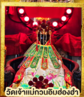
วัดเจ้าแม่กวนอิมฮ่องฮำ