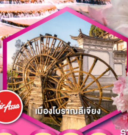
เมืองโบราณลีเจียง