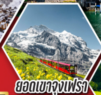
ยอดเขาจุงเฟรา