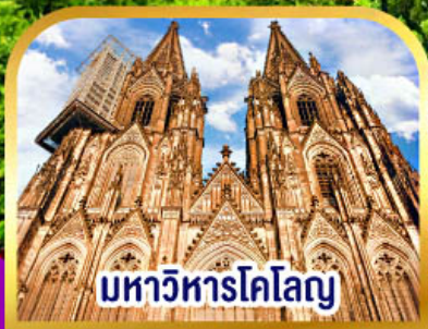
มหาวิหารโคโลญ

✓ ล่องเรือที่หมู่บ้านที่รูน เวนิสแห่งเนเธอร์แลนด์