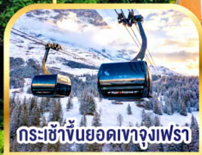
กระเช้าขึ้นยอดเขาจุงเฟรา