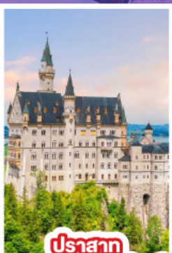
ปราสาท นอยชวานสไตน์