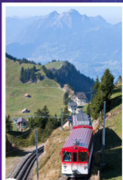
นั่งรถไฟใต้เขาเรริก