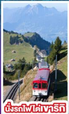
นั่งรถไฟใต้เขาเทริก