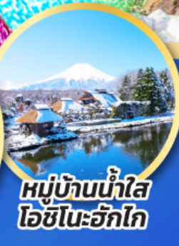
หมู่บ้านน้ำใส ไอชิโนะอัททัง