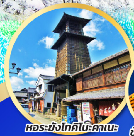
หอรบั้งโทคิโนะคาเนะ