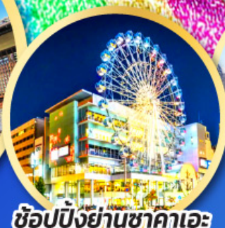
ช้อปปิ้งย่านซากาเอะ