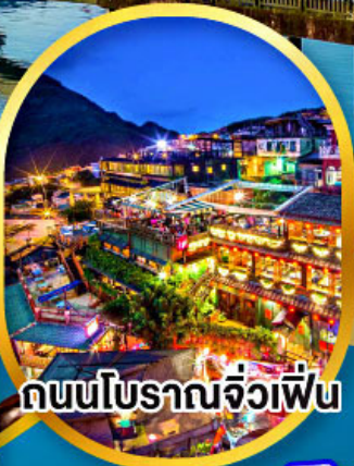
ถนนโบราณจิวเฟิน