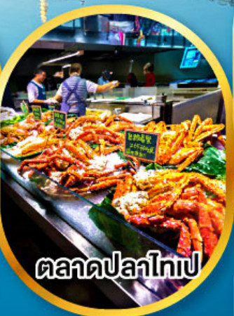
ตลาดปลาไทเป