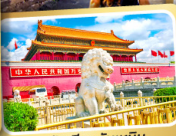
จตุรัสเทียนอันเหมิน