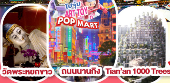
วัดพระหยกขาว ถนนนานกิง Tian'an 1000 Trees