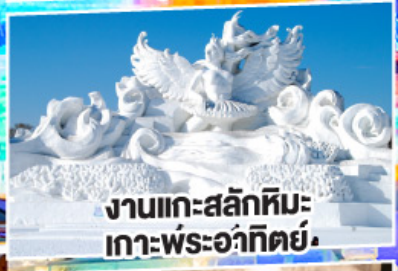
งานแกะสลักหิมะ เกาะพระอาทิตย์