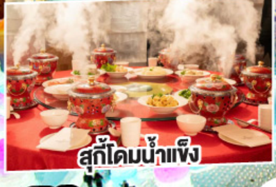
สุกี้ไคมน้ำแข็ง