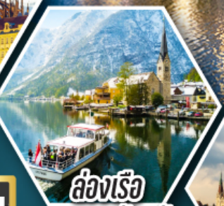
ล่องเรือ ทะเลสาบอัลสติก