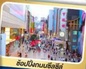
ช้อปปิ้งถนนซื่อลู่