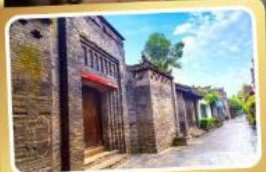
ถนนคนเดินชอยกว้างชอยแคบ