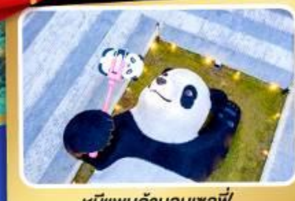
หมีแพนด้าอนเชลพี