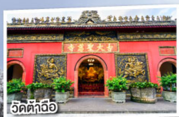
วัดต้าถื่อ