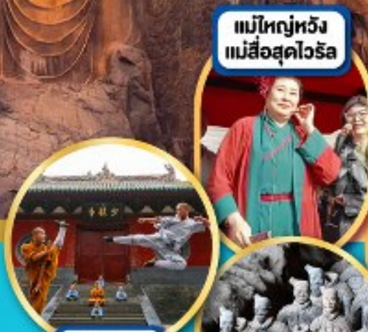
แม่ใหญ่หวัง แม่สื่อสุดไวรัล