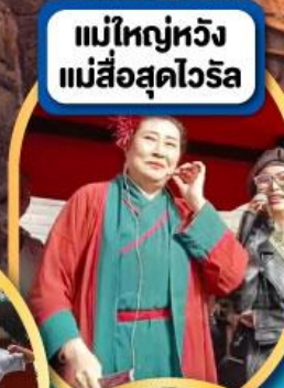
แม่ใหญ่หวัง แม่สื่อสุดไวรัล