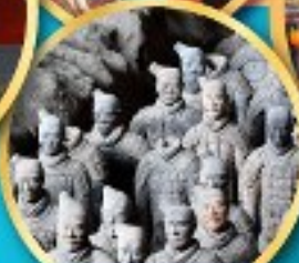
กองทัพ ทหารดินเผา จีนซี