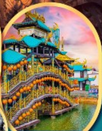
เขาว่านชู่ชาน นครจอมยุทธ