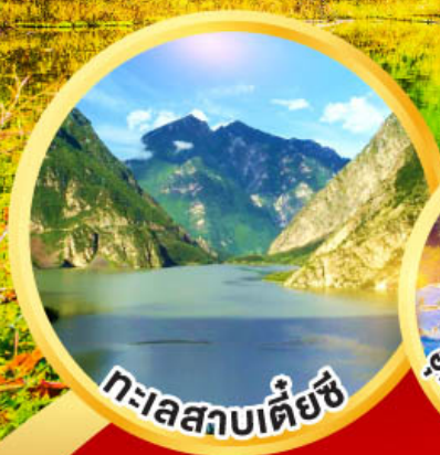
ทะเลสาบเต๋ยซี