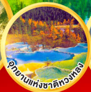
อุทยานแห่งชาติหลงหลง