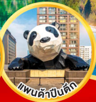
แพนด้าปิ่นดึก