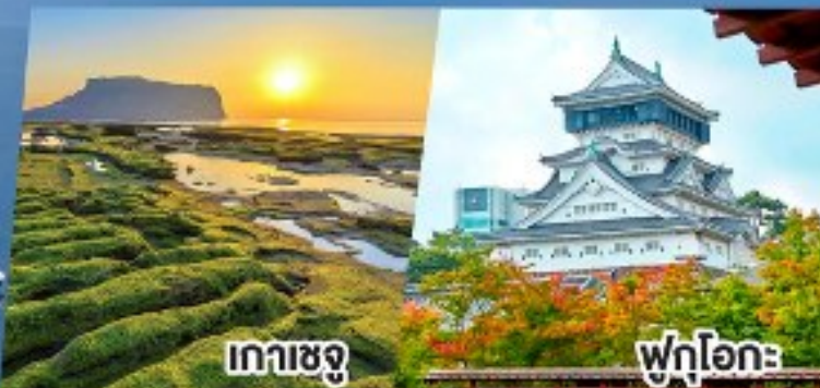
เกาะเชจู