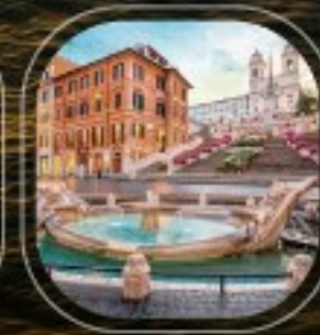
Italy Civitavecchia (Rome)

ราคาต่อคน : 175,900 บาท (รวมค่าเรือ, ค่าที่พัก, ค่าอาหารเช้า, ค่าเครื่องดื่ม, ค่าประกัน, ค่าภาษี) | ราคาใบเรือ : ค่าค่าตัว, ค่าค่าธรรมเนียม, ค่าธรรมเนียม, ค่าบริการ