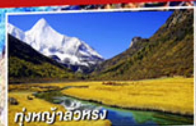
ทุ่งหญ้าลิวหลง