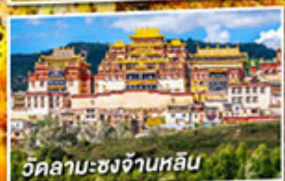
วัดลามะซงจ้านหลิน