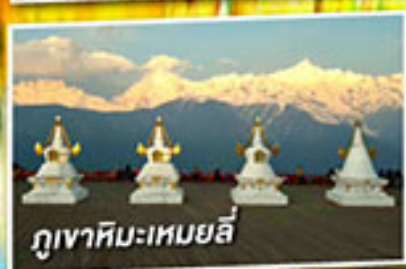
ภูเขาหิมะเหมยลี่