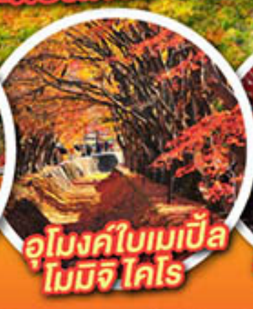
อุโมงค์ใบเมเปิ้ล โมมิจิ โคโร