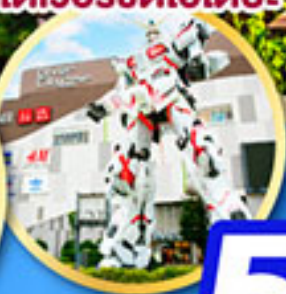
โดเวอร์ซิตีโอโดบะ