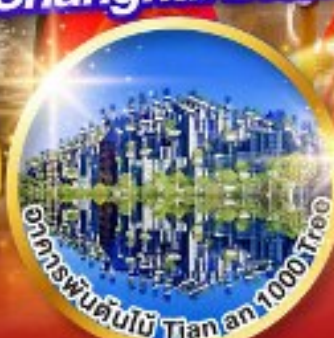
อาคารพันต้นไม้ Tiananmen 1000tree