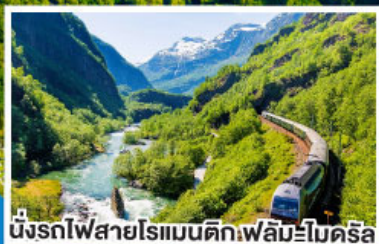
นั่งรถไฟสายโรแมนติกเฟลัมโบโคร์