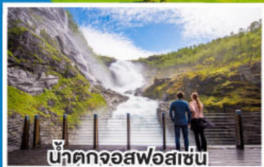
น้ำตกจอสฟอสแซน