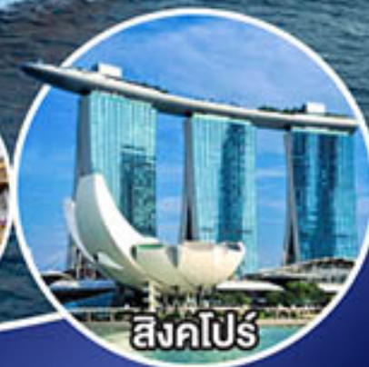
สิงคโปร์