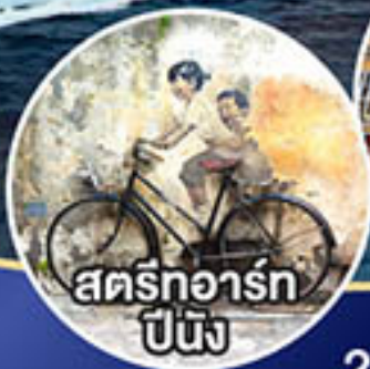
สตรีทอาร์ต ปีนัง