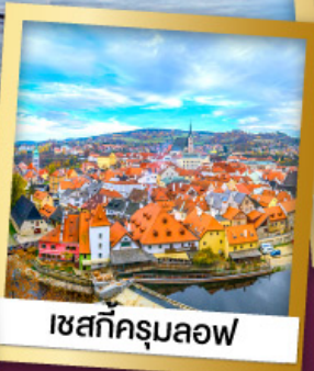
เซสกีครุมลอฟ