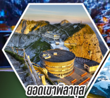
ยอดเขาพิลาตุส