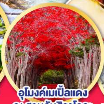
อุโมงค์ไม้แป้นแดง ณ สวนลับฮิราโอกะ