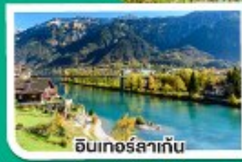
อินเทอร์ลาเก็น