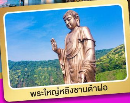
พระใหญ่หลิงซานต้าฝอ