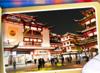
ตลาดร้อยปีเจิ้งหวิงเหมียว