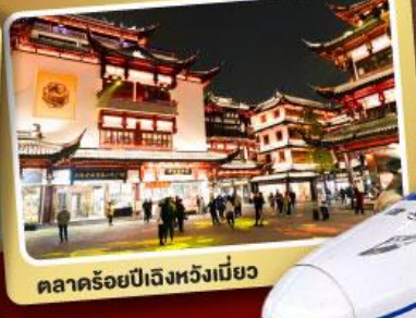
ตลาดร้อยปีเจิ้งหวิงเมี่ยว