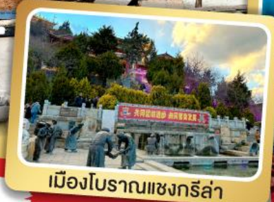
เมืองโบราณแซงกรี่ล่า