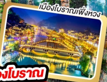
เมืองโบราณฝิ่งหวง