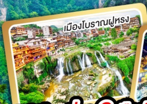
เมืองโบราณฟูหลง