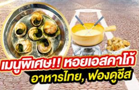
เมนูพิเศษ!! หอยเอสคาโก้ อาหารไทย, ฟองดูชีส