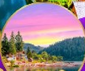
ทิกเก้ ปาด้า