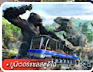
ยูนิเวอร์แซลส์ไอส์แลนด์