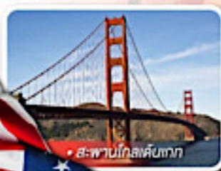
สะพานโกลเด้นเกต