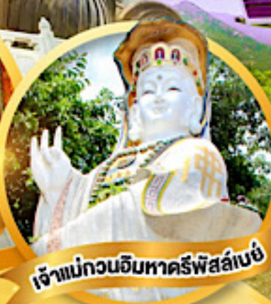
เจ้าแม่กวนอิมหาครีพีส์ลีย์