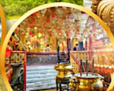
วัดม้านใหม่