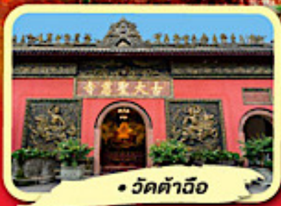
• วัดต้าอี้อ