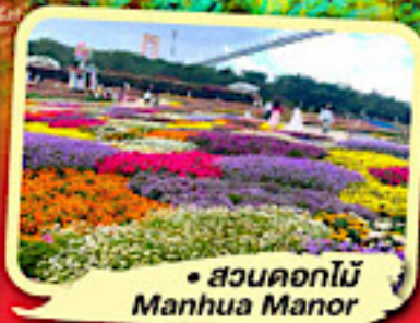
• สวนดอกไม้ Manhua Manor