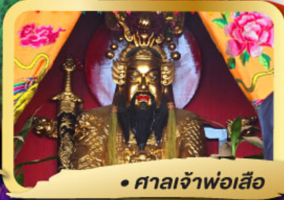
• ศาลเจ้าพ่อเสือ