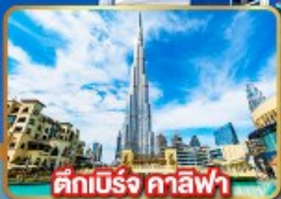
ตึกเบิร์จ คาลิฟา