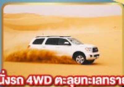
นั้รถ 4WD ตะลุยทะเลทราย