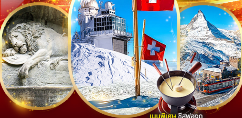
เมนูพิเศษ ชีสฟองดู