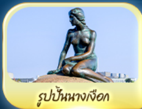
รูปปั้นนางเงือก