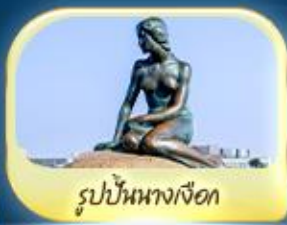
รูปปั้นนางเงือก