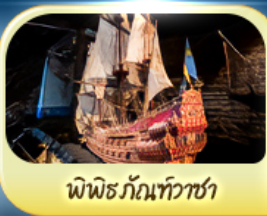
พิพิธภัณฑ์ท้าวชา