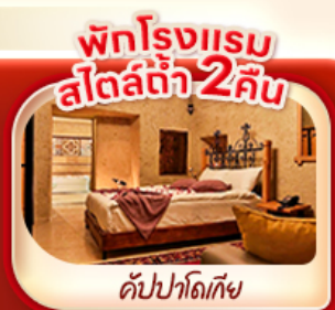
พักโรงแรม สไตล์ต้า 2 คืน