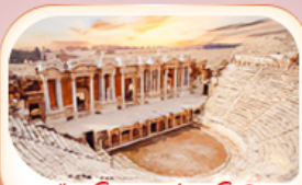
เมืองโบราณฮิยราโพลิส