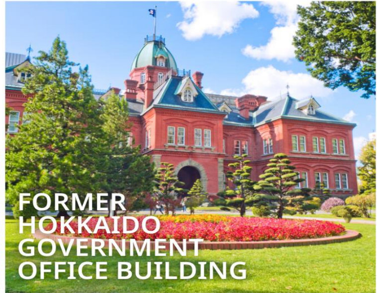
FORMER HOKKAIDO GOVERNMENT OFFICE BUILDING

เป็นตึกสไตล์นีโอบารอค มีลักษณะพิเศษที่มีหลังคายอดแหลมและกรอบหน้าต่างเป็นเอกลักษณ์ เปรียบเสมือนอนุสาวรีย์การบุกเบิกของฮอกไกโด ปัจจุบันได้รับการขึ้นทะเบียนเป็นมรดกทางวัฒนธรรมของชาติ