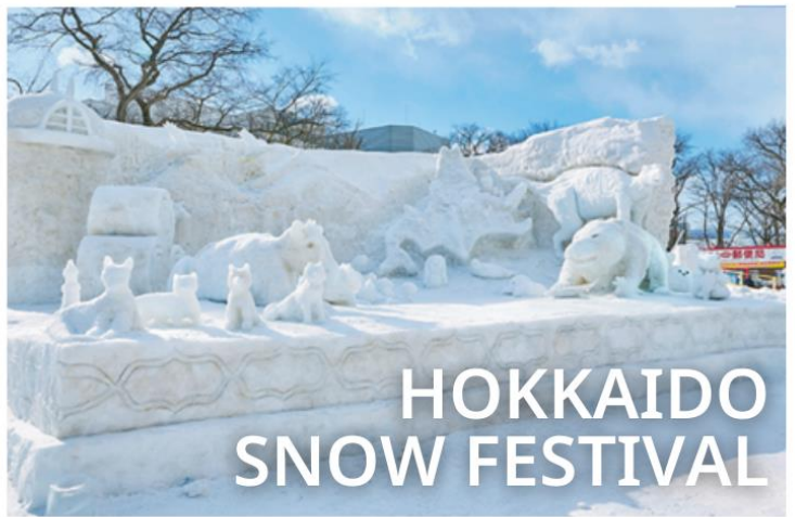
HOKKAIDO SNOW FESTIVAL

ซึ่งเป็นงานเทศกาลฤดูหนาวสุดยิ่งใหญ่ประจำปีของเมืองฮอกไกโดที่จัดขึ้นในช่วงเดือนกุมภาพันธ์ของทุกปี เป็นงานเทศกาลที่ได้รับความสนใจจากผู้คนทั้งในและต่างประเทศเป็นจำนวนมาก ซึ่งแต่ละปีจะมีนักท่องเที่ยวแห่เข้าชมงานอย่างล้นหลามโดยในปีล่าสุดมียอดผู้เข้าร่วมงานถึง 2 ล้านคนเลยทีเดียว อีกทั้งยังเป็นกิจกรรมที่ได้รับความนิยมมากที่สุดของชาวญี่ปุ่นเลยก็ว่าได้ เทศกาลจัดช่วงวันที่ 4-11 กุมภาพันธ์