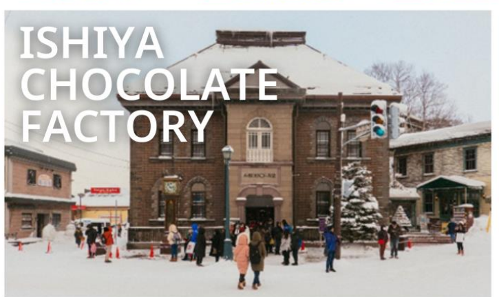
ISHIYA CHOCOLATE FACTORY