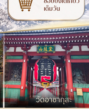
โทเทมมะเอาก์เล็ด